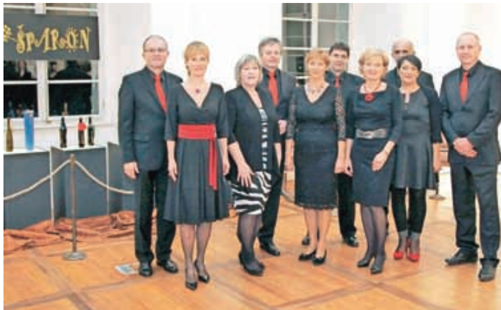
Šparonovi na slovesnosti ob 20. polnitvi, konec leta v Baročni dvorani / FOTO: GORAZD KAVČIČ

Nekaj ga shranimo, nekaj pa podarimo prijateljem, ljudem, ki so nam blizu, ki jih cenimo Šparonove