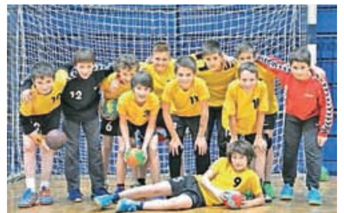
Ekipa mlajših dečkov roketnega kluba Radovljica

»Leta 2011 smo bili zaradi finančnega stanja prisiljeni ukiniti člansko ekipo. Takrat smo si postavili cilj, da bomo