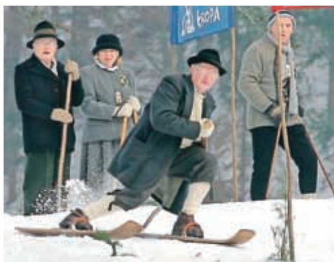
Na štartu za gostilno Jerem v Kropi se je letos zbralo 55 smučarjev, ki so se pogumno podali po strmem klancu.