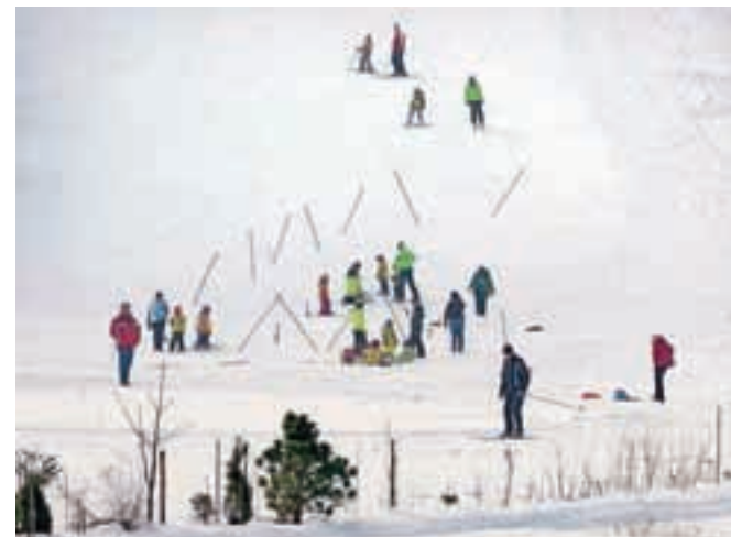
Živahno dogajanje na smučišču v Kamni Gorici prejšnji konec tedna

Čeprav je do zimskih šolskih počitnic še več kot mesec dni, otroci s polno žlico zajemajo zimske radosti. Nekateri na radovljiškem drsališču, drugi na smučišču v Kamni Gorici, spet tretji kar na domačem dvorišču.