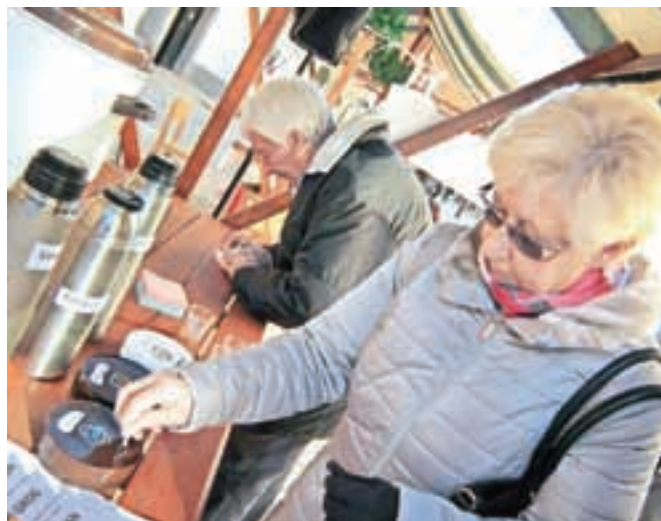
Zadnjo decembrsko soboto je na Linhartovem trgu potekala pokašina in ocenjevale.