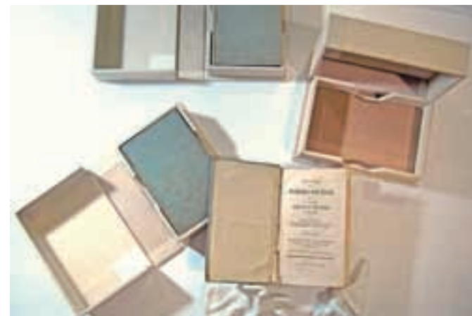
Mestni muzej Radovljica hrani originalne izvode Linhartovega dela Poskus zgodovine Kranjske in ostalih dežel južnih Slovanov Avstrije (1788, 1791), ki so si jih poslušalci lahko ogledali po predavanju.