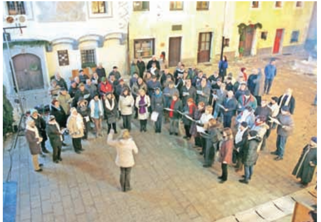
Vseh sedem zborov je s pesmijo zaključilo koledovanje na Linhartovem trgu.

Tako je bilo tudi v starem mestnem jedru Radovljice, kjer so tudi letos pripravili posodobljeno obliko koledovanja. Sodelovale so pevske skupine ljubiteljskih kulturnih društev: moški in ženski pevski zbor Koledva iz Kroppe, Mešani pevski zbor Veteran Radovljica, Mešani pevski zbor Ljubno, Moški pevski zbor Podnart, Mešani pevski zbor Anton Tomaž Linhart Radovljica, Kvintet