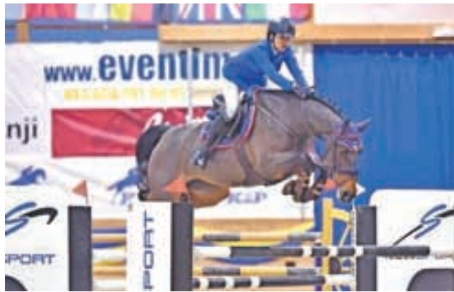
Tekmuje tudi kot članica slovenske reprezentančne ekipe.

»Tako kot vsak vrhunski športnik si želim doseči čim boljše rezultate. Na dolgi rok mogoče tudi udeležbo na olimpijskih igrah.«