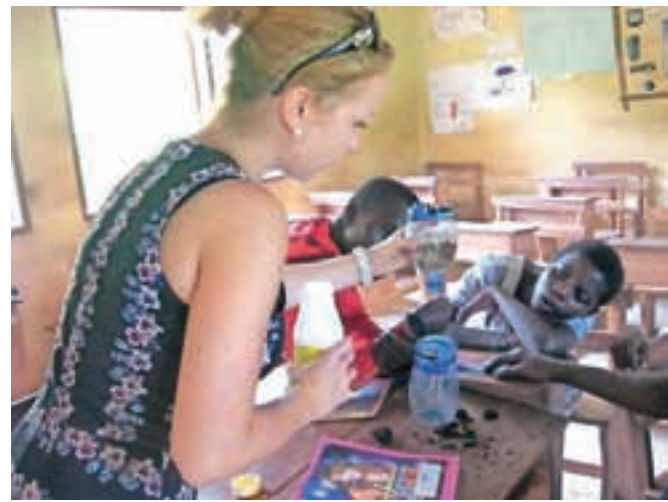
Izdelava vodnega filtra

Poleg okoljevarstvenih vidikov smo obravnavali tudi druge teme, ki so se na urniku pojavile spontano, kadar so otroci pokazali interes zanje. Zaradi izbruha virusa ebola smo se na primer pogovarjali o eboli, spet drugič smo spoznavali tipe energije. V Gani so z izgradnjo jezusa Akosombo na reki Volta ustvarili po površini največje umetno jezero na svetu. V učne urice sem skušala vključiti praktične primere, eksperimente, kreativnost in lekcije, zanimive za njihova življenja. Delo z otroki je bilo nepozabno. Vsi sanjajo o bodočem poklicu, so motivirani za znanje, uživajo ob predvajanju dokumentarcev in risankah ter obožujejo nogomet in tradicionalno jed fufu. So nasmejanih obrazov, polni energije in potencialov, njihova vedoželjnost ne pozna meja. Sama sem se od njih naučila veliko. Predvsem o tem, da je življenje pravzaprav enostavno, da v Gani čas ni vladar, da se hvaležnost ne izraža z darili, temveč prešernim nasmehom, in še in še. Ostali so nepozabni spomini na deželo čudežnih otrok, gostoljubnih ljudi, čudovite narave, brezčasnosti, včasih čudaških večernih ceremonij, vročine in vlage, fufuja, metuljev, kuščarjev, koz in glasnih ptic, ki so tri mesece skrbele za moje jutranje vstajanje. Živela sem drugačno življenje. Drugačno v smislu preprostosti, iznajdljivosti, spontanosti, pozitivne naravnosti in nesebičnosti. Življenje, v katerem je vrednota družine bolj prvobitna, kjer štejejo skromnost, poštenost in