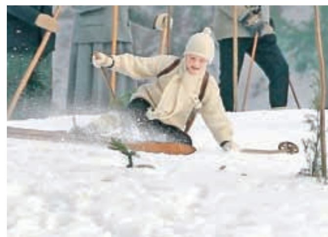
Volnen pulover, kapa s cofom in lesene smuči – tudi tako se da vijugati med vratci.