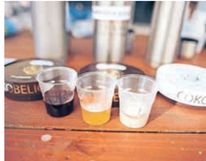
Naključni obiskovalci so največ glasov namenili napitku "Radovljica Punsch", avtorja recepta sta iz Velike Britanije.