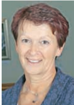
Tea Beton

ža Linharta Radovljica kot učiteljica v podaljšanem bivanju. To je moj prvi mandat v delovanju v občinskem svetu. Za sodelovanje v lokalni politiki sem se odločila, ker si želim sodelovati pri ustvarjanju ljudem prijazne občine. Kot občinska svetnica bom podpirala predloge, ki bodo koristili občanom, zavzemala se bom za projekte, ki bodo usmerjeni k reševanju socialnih težav in krepitvi socialnega okolja. Seveda pa se bom trudila tudi za vključevanje čim večjega števila občanov v športno dejavnost, saj me veseli, da je naša občina med drugimi znana tudi kot občina športa.