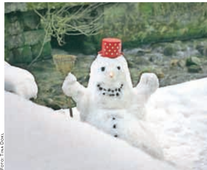
Nekateri na snegu uživajo kar na domačem dvorišču.

9. in 16. uro, po dogovoru tudi izven delovnega časa. Radovljiško drsališče med tednom obratuje od 15. do 18. ure, ob sobotah, nedeljah in praznikih ter v času šolskih počitnic pa od 10. do 18. ure. Za otroke in mladike v starosti do 18 let ter vrtnice in šole občine Radovljica bo drsanje še naprej brezplačno. Vstopnice za odrasle rekreativce bodo tako kot lani napredaj po dva evra, nespremenjena pa ostaja tudi cena rezervacij za skupine, to je 30 evrov na uro.