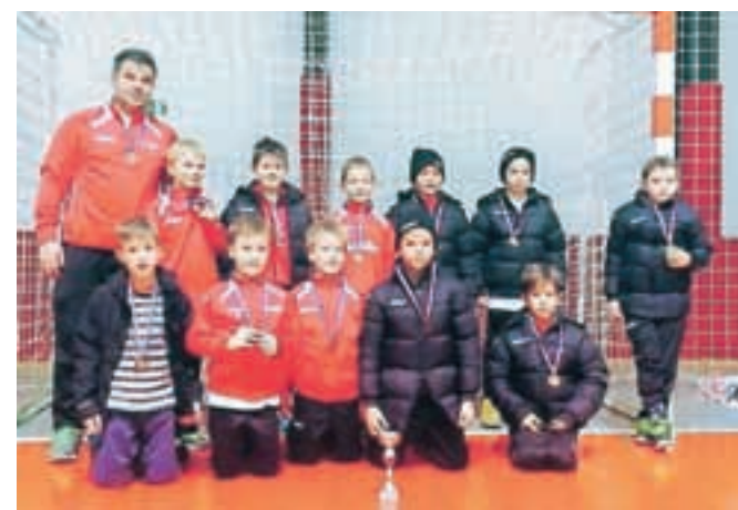
Prva leška ekipa U-9 je v Zagrebu osvojila četrto mesto.