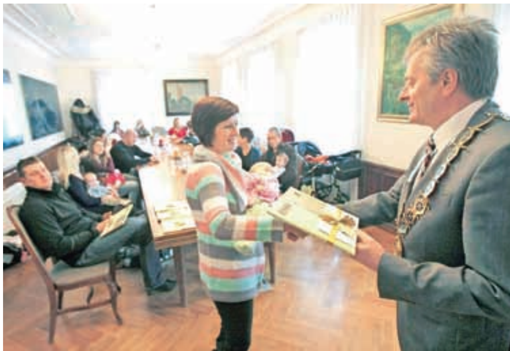
Na sprejem pri županu je v lanskem letu prišlo 183 novorojenčkov s starši.

Po podatkih Statističnega urada Republike Slovenije je na dan 1. 1. 2014 v občini Radovljica stalno prebivalo 18.848 prebivalcev, od tega je bilo 1044 otrok od prvega do petega leta starosti, to je 83 otrok več kot na primer 1. januarja 2011. Kot pojasnjujejo na radovljiški občinski upravi, pa je tako iz projekcije kot iz dejanskega stanja v občini Radovljica zaslediti, da je število otrok v starosti od enega do petih let doseglo najvišjo točko v letu 2013, v letu 2014 pa opazimo rahel upad.