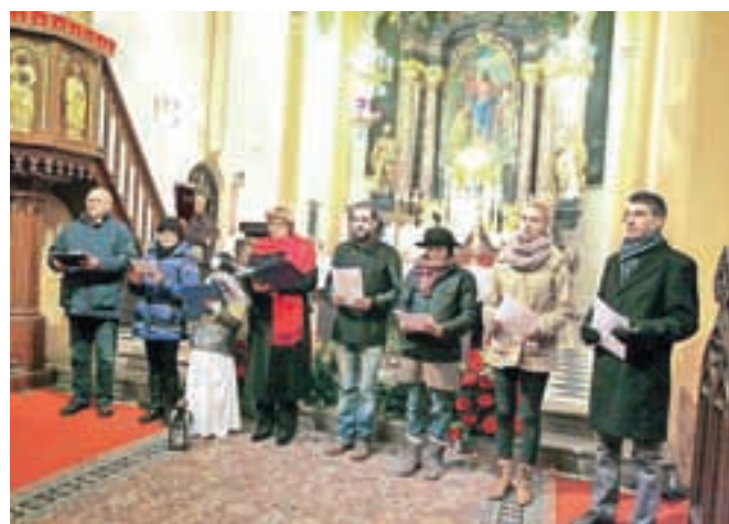
Linhartov oder v radovljiški cerkvi svetega Petra