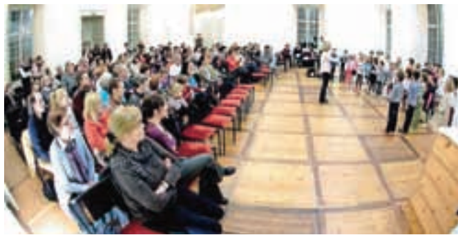
Nastop učencev Waldorfske šole