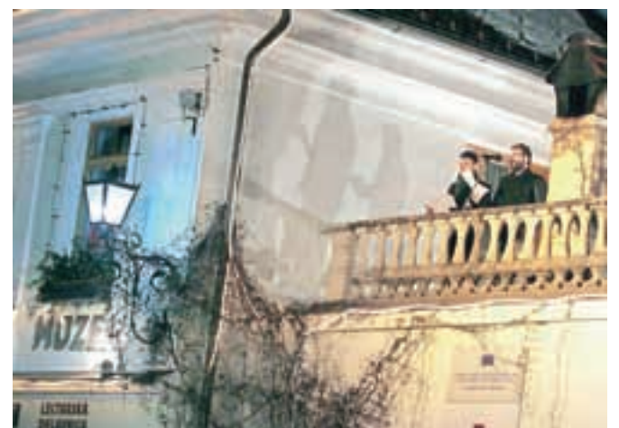
Dobre želje še s terase gostilne Lectar