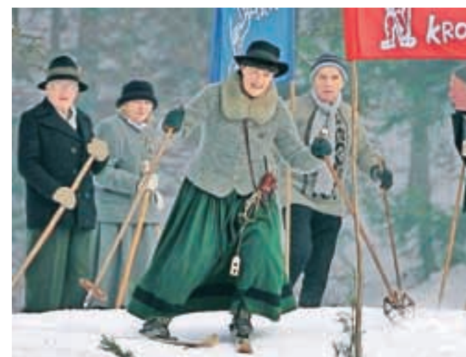
Po damsko, v debelem krilu, so se po hribu spustile smučarke. »Ena, štirinajst,« je rezultat prve tekmovalke naznanil napovedovalec. »Enot mi niso sporočili ...«