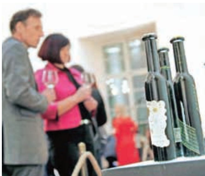
Gostje so si ogledali zbirko stekleničk, ki je nastala v dveh desetletjih, in z navdušenjem okušali vina dvajsetih slovenskih vinarjev.