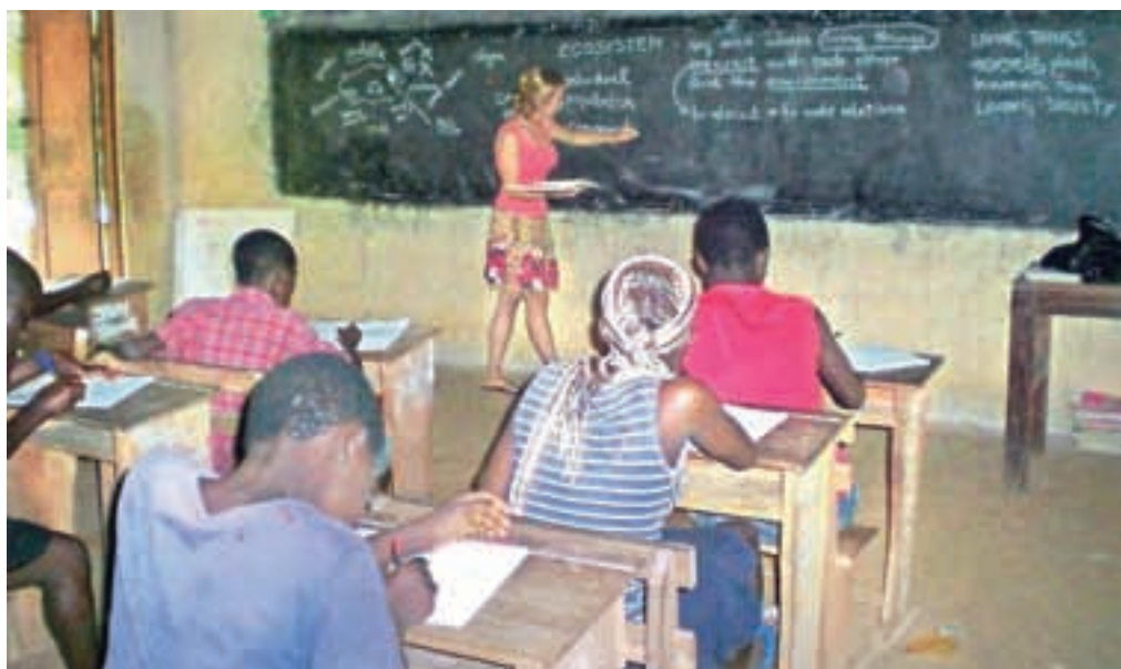
Kaj je ekosistem?

dejanji vplivamo na življenje svojih bližnjih pa tudi tistih, ki živijo na drugi strani sveta. S svojim odnosom in ravnanjem lahko prispevamo, da bo leto 2015 polno ljubezni in zadovoljstva pri nas doma pa tudi drugod po svetu. Pa srečno!