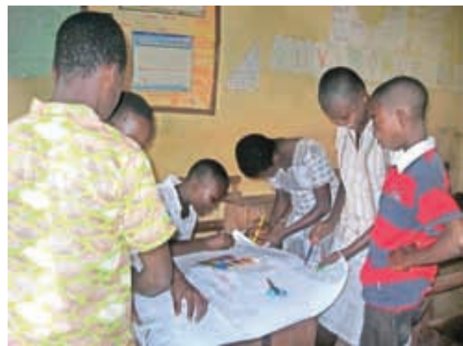
Izdelava ekološke piramide

delavnost. Zahodnjaški svet v Gani še ni uspel potepati osebne sreče in vsiliti duha materializma. V novo leto vstopam z novim pogledom. Svet, v katerem živimo, ni nič drugega kot globalna vasica, v kateri vsak prispeva svoj delček. S svojimi