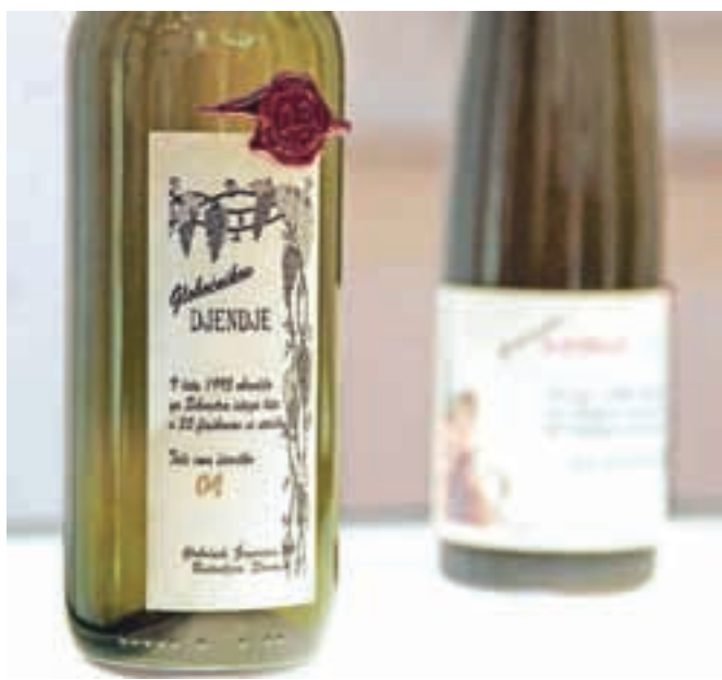
Prva steklenička Šparona