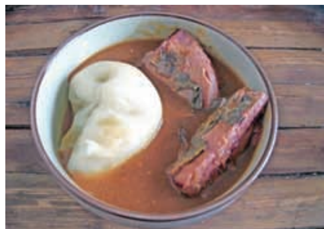
Tradicionalni fufu s tuno