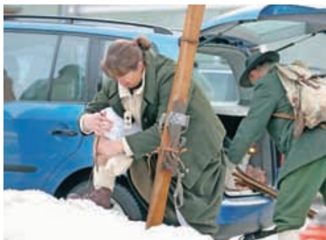
Še zadnji popravki, preden se smučarka peš odpravi na start.